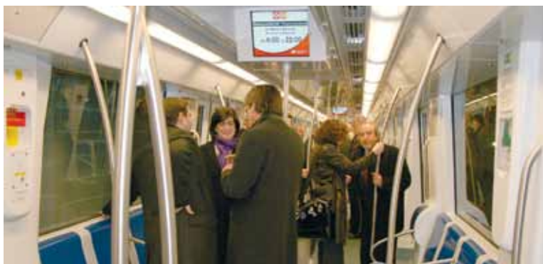
Раньше метро Барселоны закрывалось в 23 часа, но сейчас действует новый режим работы: в будние дни – с 5 утра до полуночи, по пятницам – до 2 часов ночи, а по субботам – круглосуточно

на глубине 60–80 метров, а пассажиры смогут спуститься на платформу на скоростных лифтах. Тоннель метро диаметром 12 метров разделен на два уровня, по которым движутся поезда в противоположных направлениях. Сами платформы располагаются в этом же тоннеле, и в будущем, при необходимости, их длину можно увеличить. Этот новейший метод строительства признан не только удобным, но и менее затратным, поэтому в дальнейшем его планируется использовать при строительстве других линий. Сооружение двухуровневого тоннеля – не единственное изобретение испанских инженеров. Метрополитен Барселоны получил известность еще и благодаря принципу организации посадок и высадки пассажиров, названному «барсе-