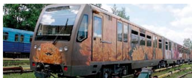
Поезд «Акварель» был сделан на базе вагонов «Русич»